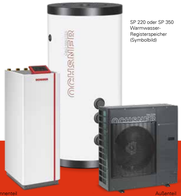
SP 220 oder SP 350 Warmwasser- Registerspeicher (Symbolbild)