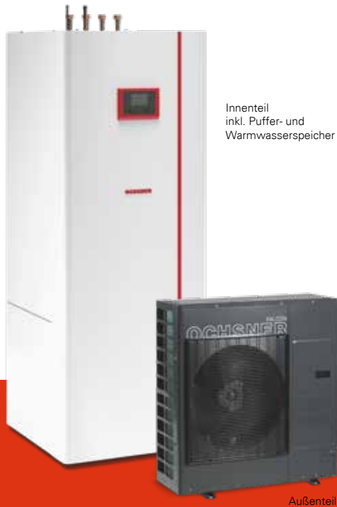
Innenteil inkl. Puffer- und Warmwasserspeicher